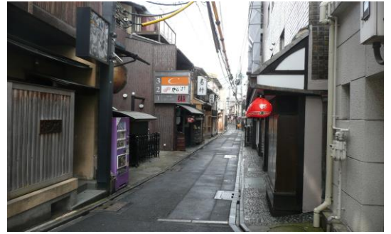
【風情のある先斗町】