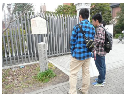
【同志社大学前「薩摩藩邸」】