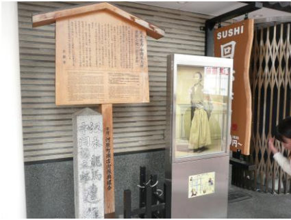
【近江屋跡】坂本龍馬、中岡慎太郎殉難の地