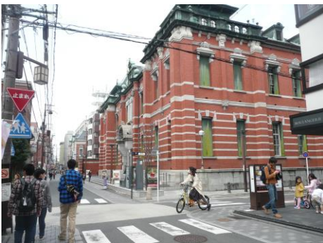
【京都文化博物館】「戦国時代展開催中」