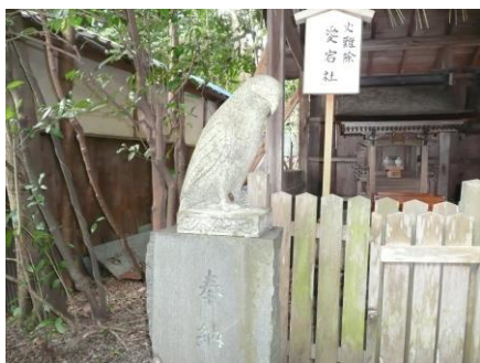
【大豊神社】 「こまとび」