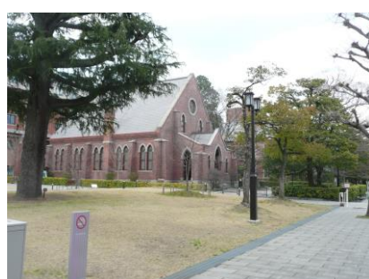
【同志社大学チャペル（重文）】