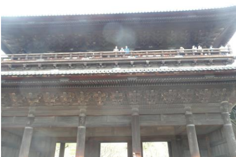
【山門上から「絶景かな〜」】