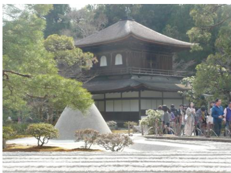
【東山慈照寺「銀閣寺」】