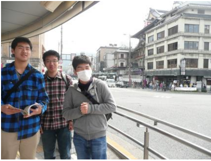
【京都南座：歌舞伎発祥の地】