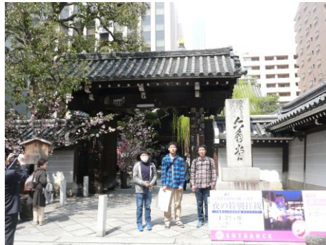
【六角堂】華道発祥の地 京都「へそ石」